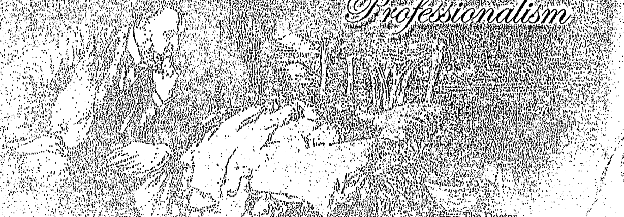
The Doctor, Sir Samuel Luke Fildes, 1843-1927